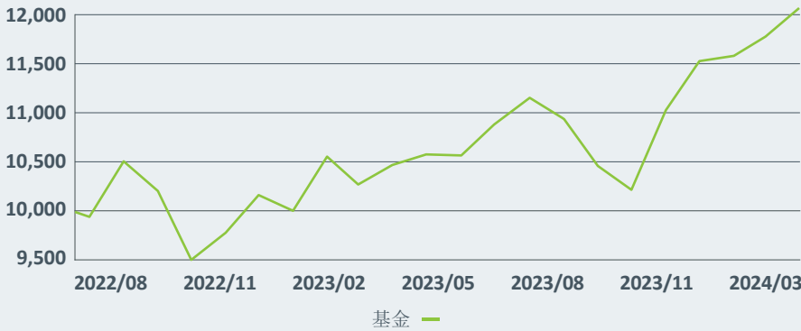
假設自股份成立日起投入一萬元本金的累積表現(新台幣累積類型)

本基金運用特有的動態資產配置策略，持續發掘趨勢多元資產投資機會，追求長期穩健且有競爭力的收益。本基金利用全球化佈局，投資標的分散在不同資產類別、產業與區域，大量且廣泛地投資在貝萊德集團所發行之指數股票型基金（ETF）以及共同基金，且所投資的產業，係參考MSCI世界指數，包含但不限於科技、金融、健康護理、原物料、能源以及房地產等產業