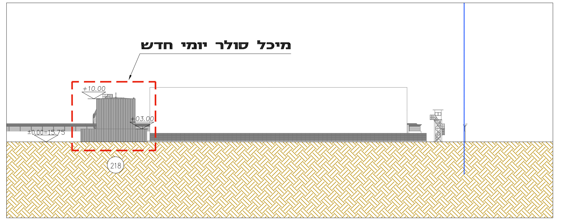
חתך C-C קנ"מ 1 : 500