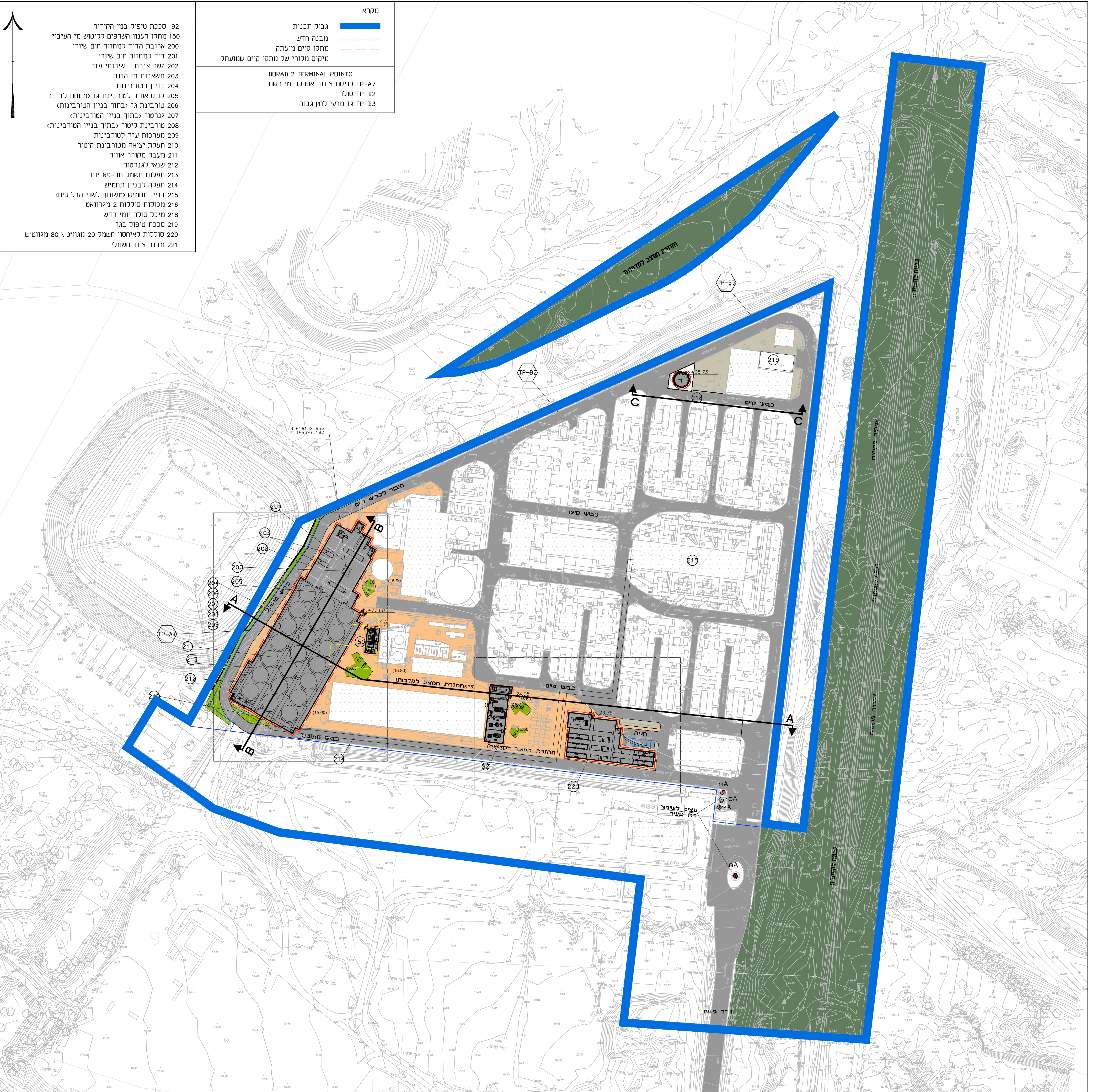
תכנית גגות קנ"מ 1 : 1250